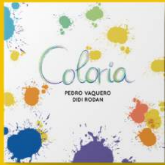
Coloria INCERTIDUMBRE, MIEDO, RESILIENCIA