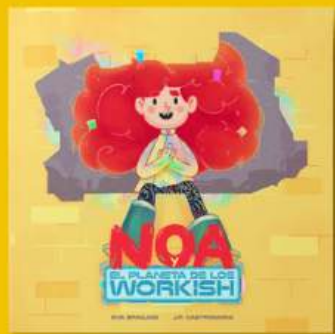
Noa y el planeta de los workish BÚSQUDA DEL PROPÓSITO, ADICCIÓN A LA TECNOLOGÍA