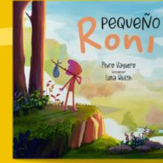
Pequeño Roni EMPODERAMIENTO, AUTOESTIMA AUTOCONOCIMIENTO