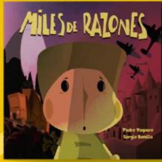
Miles de razones CONFLICTOS ARMADOS, PAZ