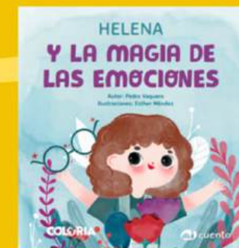
La magia de las emociones INTELIGENCIA EMOCIONAL