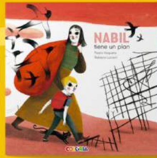
Nabil tiene un plan REFUGIADOS, CREATIVIDAD