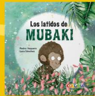
Los latidos de Mubaki MALTRATO ANIMAL, INTELIGENCIA EMOCIONAL