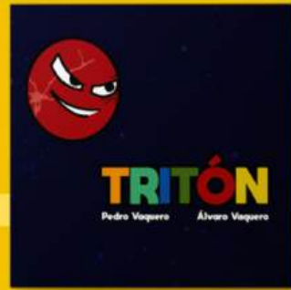
Tritón BULLYING, AGRESIVIDAD, ABUSO, AUTOESTIMA