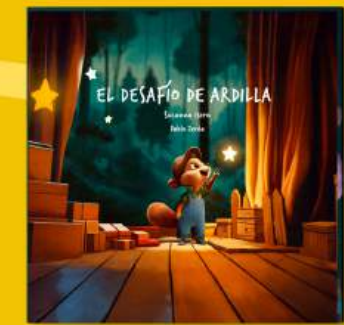
El desafío de ardilla ENFERMEDAD, RESILIENCIA