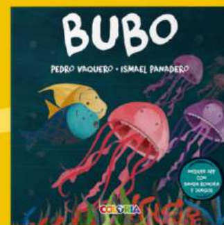
Bubo TRABAJO CON MIEDOS, INTELIGENCIA EMOCIONAL