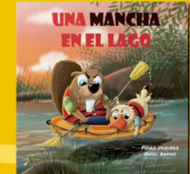
Una mancha en el lago MEDIOAMBIENTE, RESOLUCIÓN DE CONFLICTOS