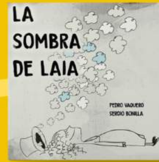
La sombra de Laia DIVERSIDAD, AUTOESTIMA, RECHAZO