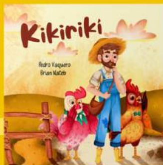
Kikiriki TOLERANCIA, IDENTIDAD SEXUAL