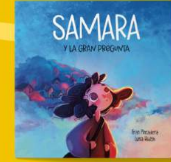
Samara y la gran pregunta RESILIENCIA, AUTOESTIMA